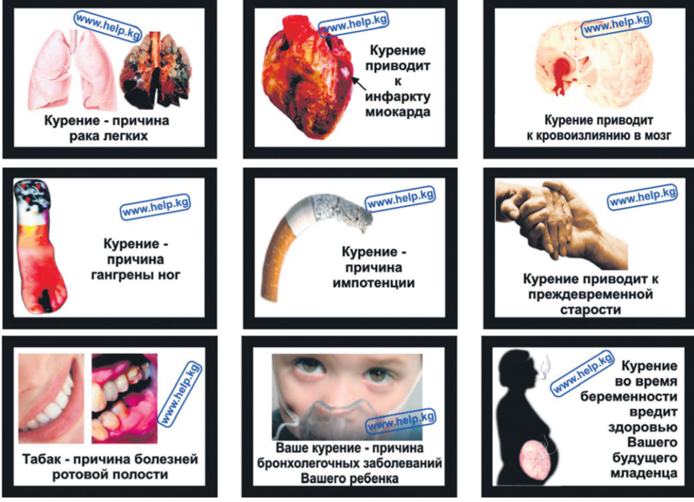
Рисунок 2. Текст и рисунки медицинских предупреждений на упаковках табачных изделий пачках (на примере твердой упаковки сигарет типа Winston, Marlboro, L&M) с расчетным расположением их на упаковке табачных изделий (приложение 1Б).

Рисунок 1. Текст и рисунки медицинских предупреждений на пачках (на примере твердой пачки сигарет типа Winston, Marlboro, L&M) табачных изделий с расчетным расположением их на пачке сигарет (приложение 1А).